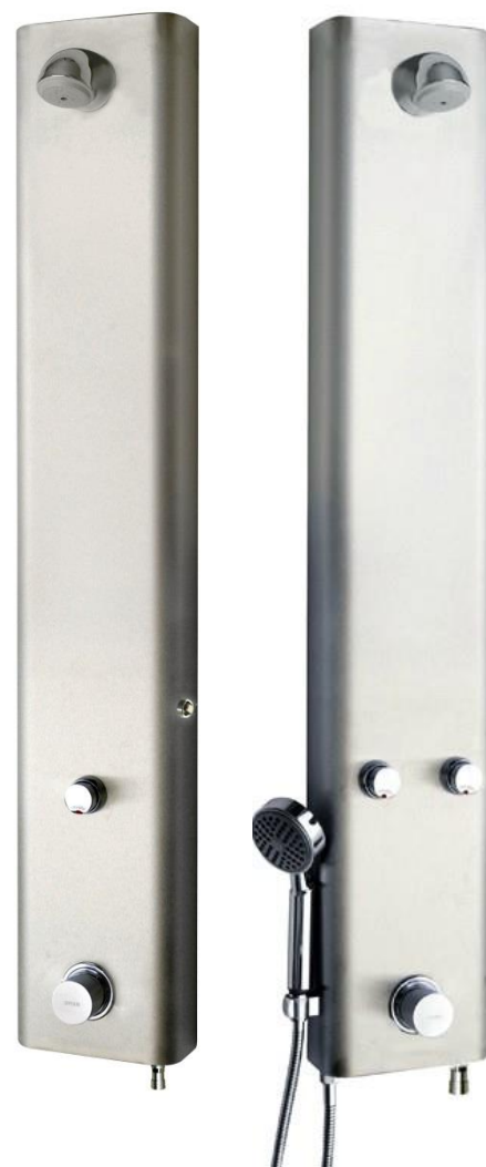
DP-2 Therm SU